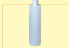
Spryskiwacz 125 ml REF 540 0075 0