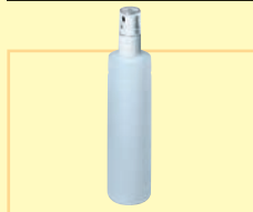
Spryskiwacz 125 ml REF 540 0075 0