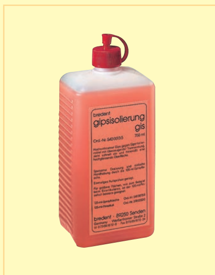
Spryskiwacz 750 ml REF 540 0013 5