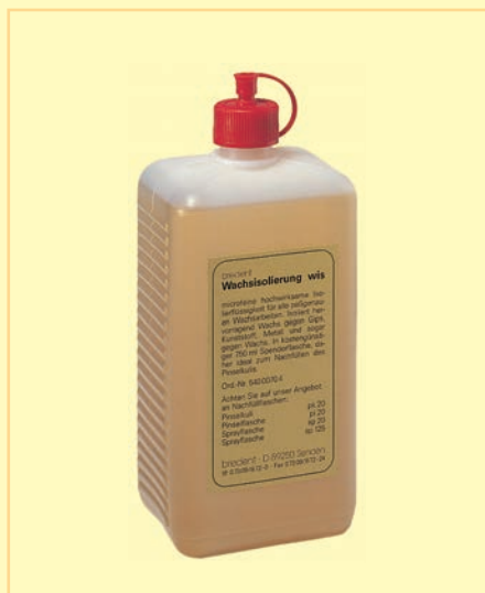
Izolator do wosku z dozownikiem 750 ml REF 540 0070 4