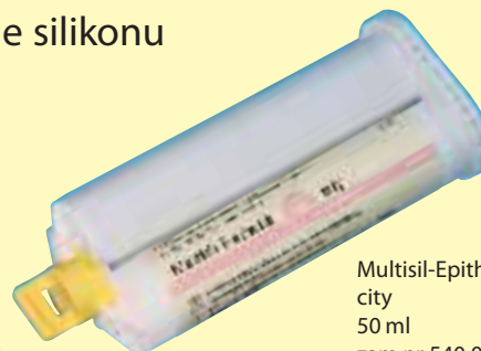
Multisil-Epithetik city 50 ml zam.nr 540 0106 4