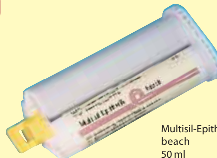
Multisil-Epithetik beach 50 ml zam. nr 540 0106 6